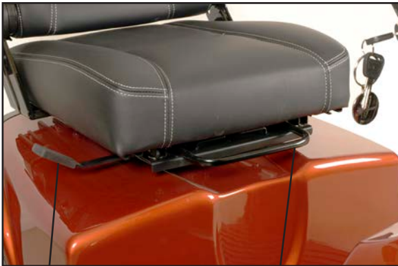
Udløserhåndtag for sædedrej. Udløserhåndtag for sæde frem/tilbage.

Andre sæder, som kan leveres til Mini Crosser er opbygget efter samme princip. Udløserhåndtaget er som standard monteret i højre side, kan efter ønske monteres i venstre side.