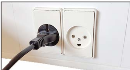
Tilslut stikket til stikkontakten.

Yderligere information: Se Brugervejledningen.