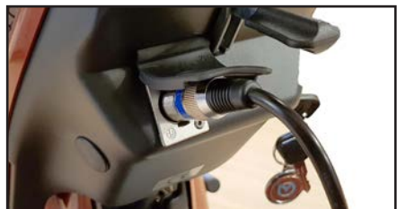
Ladestik forbindes til 3-polet stik på styr-stammen. Ladestikket er placeret under beskyttelsespladen.