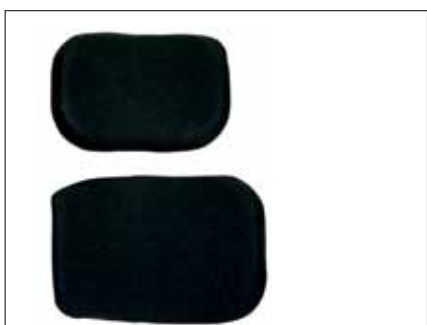
Polster 11x15 eller 13x18 cm