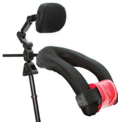
Ultra vist med i2i lav profil

Ultra systemet kan aflaste hoved og giver god nakkestøtte. Den dybdejusterbare hovedpude tillader at nakkestøtten er eneste kontaktpunkt i opret, siddende position.