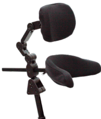
Ultra vist i standard konfiguration