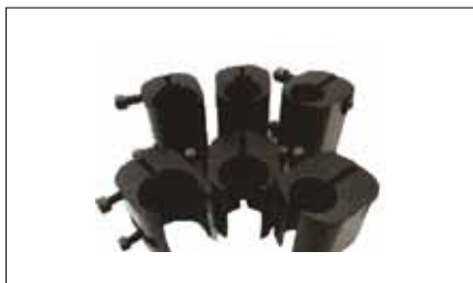
Klemmebeslag Leveres i mange forskellige størrelser

Stealth sidestøtter udmærker sig ved design og funktion. Ved daglig brug er sidestøttepolsteret kun lidt synlig og sidestøttebeslaget fylder minimalt mellem overkrop og arm. Vælg først det korrekte beslag til stolen og derefter korrekt polsterstørrelse til brugeren. Alle sidestøttebeslagene er udsvingbare, hvilket er en hjælp ved ind og udstigning af stolen, samt