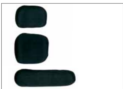
Polster 6x8, 9x9 eller 11x15 cm